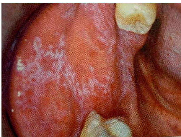
Figura 10 - Líquen Plano

É de extrema importância a realização de exames histopatológicos. Não é necessário nenhum tratamento em lesões assintomáticas, e pode ser usado esteroides tópicos ou sistêmicos em baixas doses (RODRIGUES, 2020).