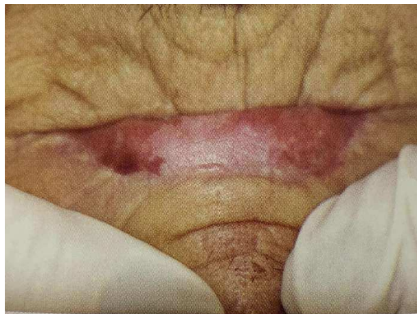
Figura 8 - Lesão Queilite Actínica

O tratamento conservador deve ser feito a partir do uso de filtro solar, tratamentos com laserterapia ou uso tópico de ácido retinóico, ou em alguns casos cirurgias associadas a biópsia (AZEVEDO, 2020).