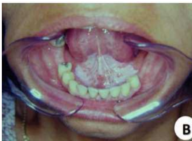
Figura 9 - Leucoplasia

Seu tratamento normalmente é realizado através da eliminação do fator predisponente e a excisão cirúrgica também é uma opção. Os diagnósticos diferenciais são Líquen plano, estomatite, candidíase, leucoplasia pilosa, lesão por mordiscamento, leucoedema e queimadura química (RAMOS, 2017).