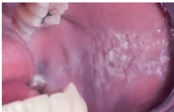
Figura 1 - Lesão por mordiscamento crônico.

Essa lesão é bastante semelhante a tantas outras lesões brancas tornando-se indispensável a investigação de todo o histórico, e como diagnóstico diferencial para mordiscamento crônico temos: a candidíase, o líquen plano, a leucoplasia pilosa, o nevo branco esponjoso e o leucoedema (SANTOS JUNIOR, 2019).