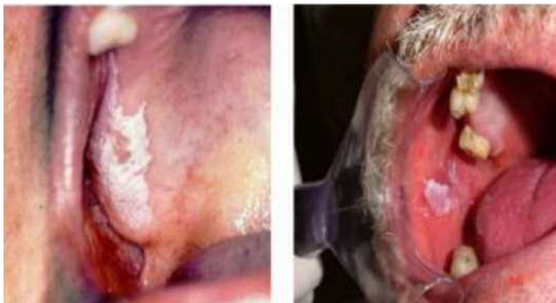
Figura 2 – Ceratose friccional

Na avaliação, caso não seja identificado nenhum tipo de fator irritativo, o diagnóstico diferencial para essa lesão é a leucoplasia, e para este tipo de lesão deve haver uma investigação mais aprofundada, e a depender do resultado histopatológico é que a conduta será definida (UFRGS, 2018).