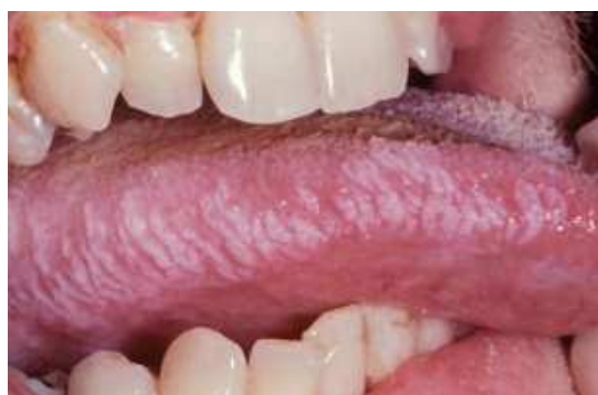
Figura 7 - Língua Pilosa

O diagnóstico diferencial é o líquen plano que se caracteriza pela presença de lesões estriadas, placas e áreas erosivas em vários pontos anatômicos da boca. Deve ser salientado que o líquen plano apenas na língua é bastante improvável (UFRGS, 2018).