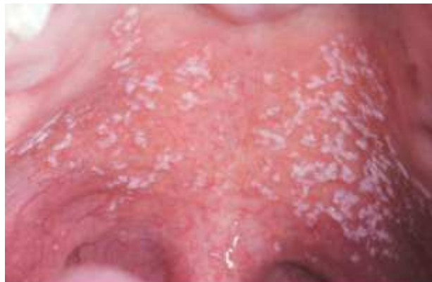
Figura 5 - Candidíase Pseudomembranosa

Os diagnósticos diferenciais para essa lesão são: leucoplasia, leucoplasia pilosa, líquen plano, nevo branco esponjoso, lesões químicas ou traumáticas (MOURA, 2019).