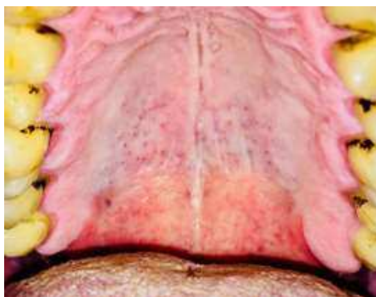
Figura 3 – Estomatite nicotínica

O tratamento mais indicado para a estomatite nicotínica é cessar com o hábito de fumar, e assim a lesão tende a desaparecer totalmente. Apesar de ser uma lesão benigna, o fato do paciente fumar excessivamente deve alertar para o caso de surgimento de outras lesões cancerígenas. Os diagnósticos diferenciais são para: leucoplasia, candidíase e líquen plano (LACERDA e MOURA, 2019).