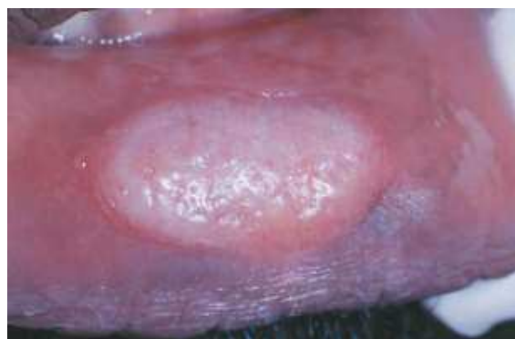
Figura 6 - Lesão de Sífilis Secundária

Além do exame clínico é necessária a solicitação de exames sorológicos como o VDRL (Venereal Disease Research Laboratory) para confirmação da doença. O tratamento é realizado a base de penicilina que deve ser sempre o medicamento de primeira escolha, e na impossibilidade do uso desta, a azitromicina, eritromicina e tetraciclina podem ser empregadas, mas tendo sempre em mente que a eficácia desses não se compara a da penicilina (KALININ, 2015).