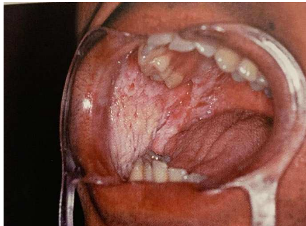
Figura 4 – Lesão Nevo Branco Esponjoso

Para fechar o diagnóstico uma citologia esfoliativa pode ser necessária. Com relação ao tratamento não é necessária nenhuma conduta, porém o paciente deve ser acompanhado periodicamente. As lesões diferenciais para esse tipo de lesão são o líquen plano e a leucoplasia (KIGNEL, 2015).