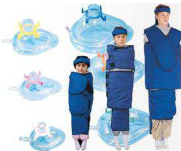
Figura 1 - Estabilização do paciente.

Na estabilização protetora além da restrição dos movimentos, o paciente também poderá necessitar do uso de abridores bucais. Durante a contenção ativa os responsáveis ou auxiliar presente, vai segurar firmemente os braços, pernas e cabeça do paciente, já na contenção passiva alguns equipamentos próprios para envolver o mesmo são usados. A escolha da técnica a ser usada não ocorre de forma unificada, o profissional precisa avaliar as necessidades de cada um, compreendendo qual melhor medida a ser adotada para garantir um atendimento seguro (MATOS; FERREIRA; VIERA, 2018).