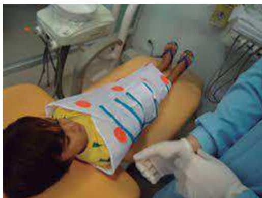
Figura 2 - Uso de roupa para estabilização protetora.