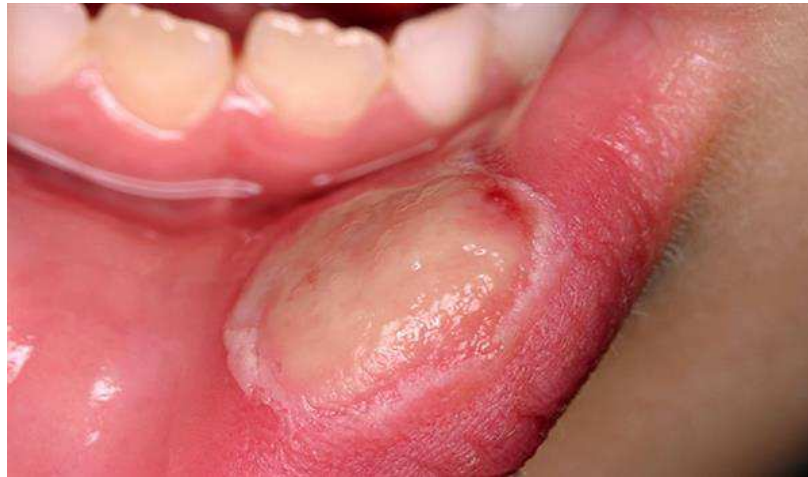
Figura 1- Mucosite