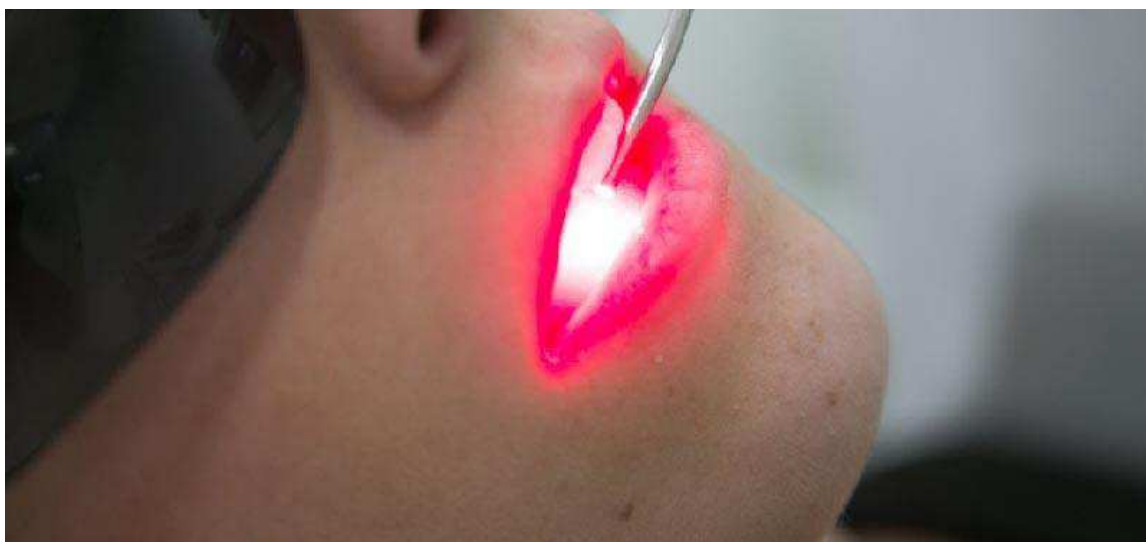
Figura 3 - Benefícios da aplicação do laser de baixa potência