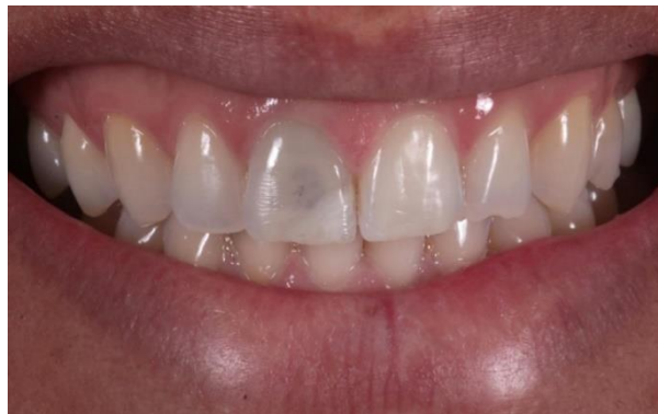
FIGURA 2 – Fatores intrínsecos: trauma.