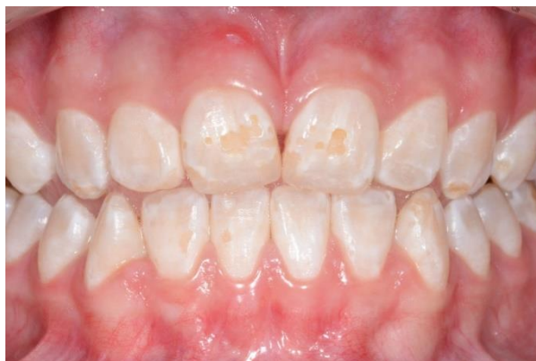
FIGURA 3 – Fatores intrínsecos: hipoplasia de esmalte.