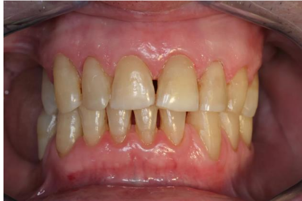
FIGURA 1 – Fatores intrínsecos: envelhecimento.